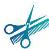
Saloni di Bellezza