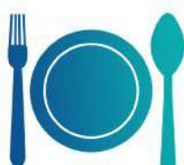
Ristoranti e Pizzerie