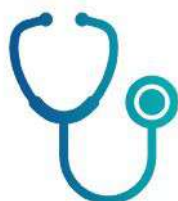
Dottori e Studi Associati