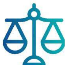
Avvocati e Studi Associati