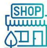
Attività Commerciali in generale